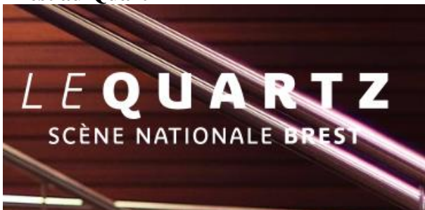
Table ronde "Où sont les femmes ?" dans le secteur culturel. Le 11 octobre à Brest au Quartz

From www.divertir.eu - 18 September, 14:07